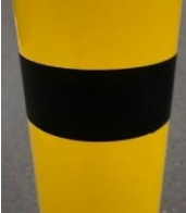
1 zwarte band